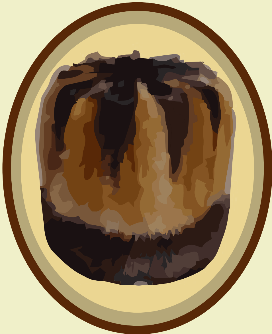
Алтайская национальная шапка Алтай бычкак бөрүк