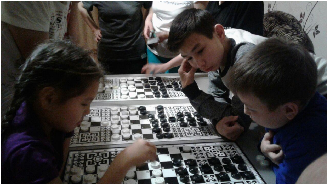
Соревнования по шатре.