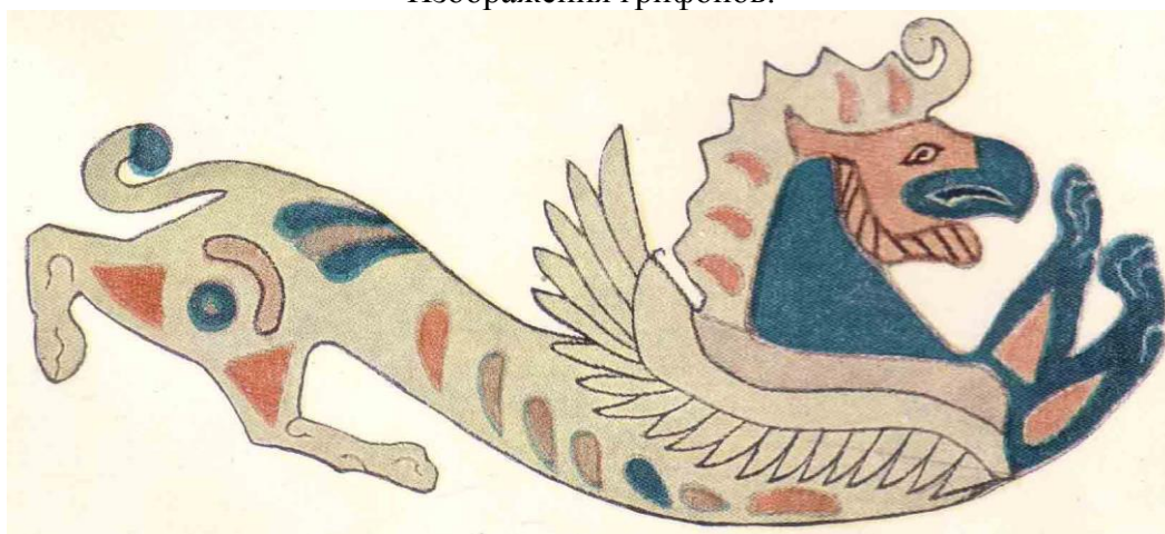
Орлиный грифон – войлочная аппликация на седельной покрывке из Второго Пазырыкского кургана.