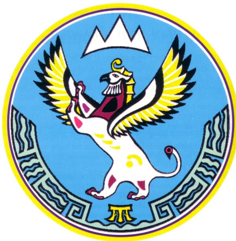
Герб Республики Алтай.